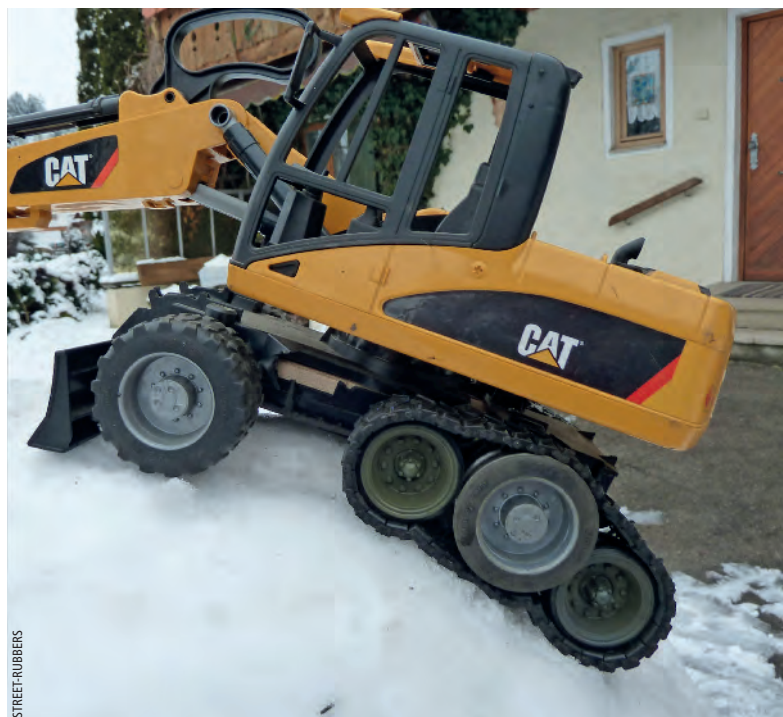
Prototyp: Aktuell entwickelt die Firma Street-Rubbers einen Umbausatz für Mobilbagger.

Seit drei Jahren beschäftigen sich die Firmengründer mit einer weiteren Innovation – einem serienmäßigen Bausatz für Mobilbagger mit einem Gewicht von 12 t bis 20 t, um diese zu einem Halbraupenbagger umrüsten zu können. Nach dem Aufbau von zwei Prototypen der All-terrainvariante, die alle Erwartungen erfüllt hatten, beschloss Street-Rubbers einen Zusammenarbeit mit der Firma Pfanzelt Forstmaschinenbau aus Rettenbach (Ostallgäu), um den Bausatz weiterzuentwickeln und seine Serienproduktion anzustreben.